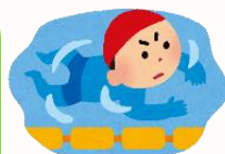
天童スイミングスクール